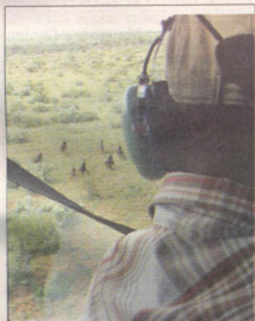
BUFFELS op die groen vlakke.